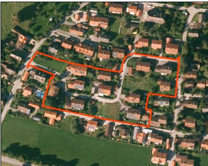
Orthophoto der Bayerischen Vermessungsverwaltung; rote Linie: Plangebiet des Bebauungsplanes „Wiesenweg West“ - 3. Änderung

Der Bebauungsplan „Wiesenweg West“ umfasst eine im Südwesten von Bichl gelegene Bebauung, welche sich entlang der Heimgartenstraße zwischen dem Wiesenweg im Osten und der Sindelsdorfer Straße im Westen erstreckt. Das ca. 1,50 ha große Plangebiet ist bereits mit 7 Einzelhäusern und 4 Doppelhäusern bebaut. 3 Grundstücke im Umfeld der bebauten Flächen sind noch unbebaut.