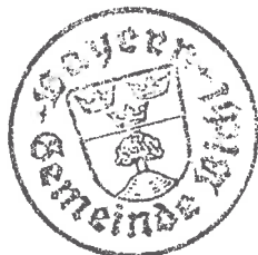
Pfund 1. Bürgermeister